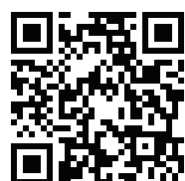
לשמיעה: סרקו הברקוד