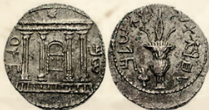
מטבעות מימי המרד. מצד אחד ציור של בית המקדש, מצד שני לולב ואתרוג

המרד נמשך שלוש שנים קשות של קרבות אחוזי שגעון של היהודים ברומאים.