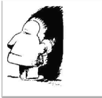
אינדיאני או אסקמואי