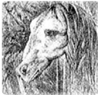
סוס או צפרדע (לסובב ימינה)