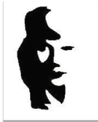
אישה או נגן סקסופון