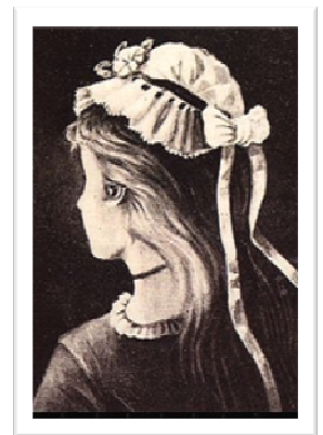
אישה צעירה או זקנה