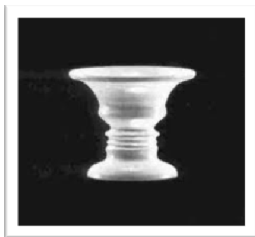
גביע או שני פרצופים