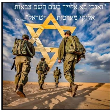
"ואנכי בא אלייך בשם השם צבאות אלוהי מערכות ישראל" (שמואל)

הלכתי לחלק אוכל לחיילים ופתאום ניגש אלי חייל ללא כיפה ואומר לי אני לא רוצה אוכל אני רוצה ציצית ושואל יש לך ציצית אמרתי לו שיש לי רק את הציצית שלי נתתי לו אותה והוא ביקש להצטלם איתי ואז הוא אמר לי את המשפט הבא.בוא נצטלם וכשאחזור מהלחימה נצטלם שוב עם הציצית שמרמה עלי.עם ישראל חי 13.04