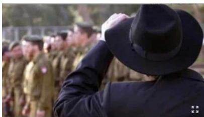
חודים בקישור להנחיתם הסייע. בתמונה חרדי וברוק וחייל צה"ל. איסון