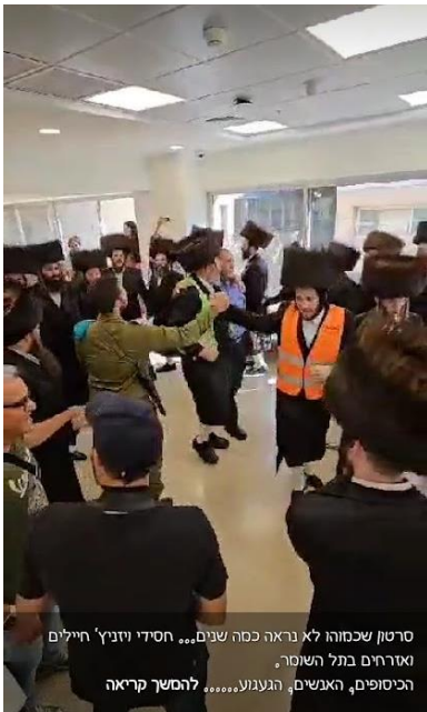
סרטון שכמוהו לא נראה כמה שנים... חסידי יוניץ חיילים ואזרחים בתל השומר, הכיסופים, האנשים, הגעגועים..... להמשיך קריאה

הכנסת אורחים במירון: חיילים, חרדים וחיבוקים: "הכנסת אורחים מירון" מאכילים מדי יום כ 2000 עד 4000 חיילים. תראו איזה סרטון מרגש. רק ביחד | By | זנחנך דאום Facebook - Hanoch Daum